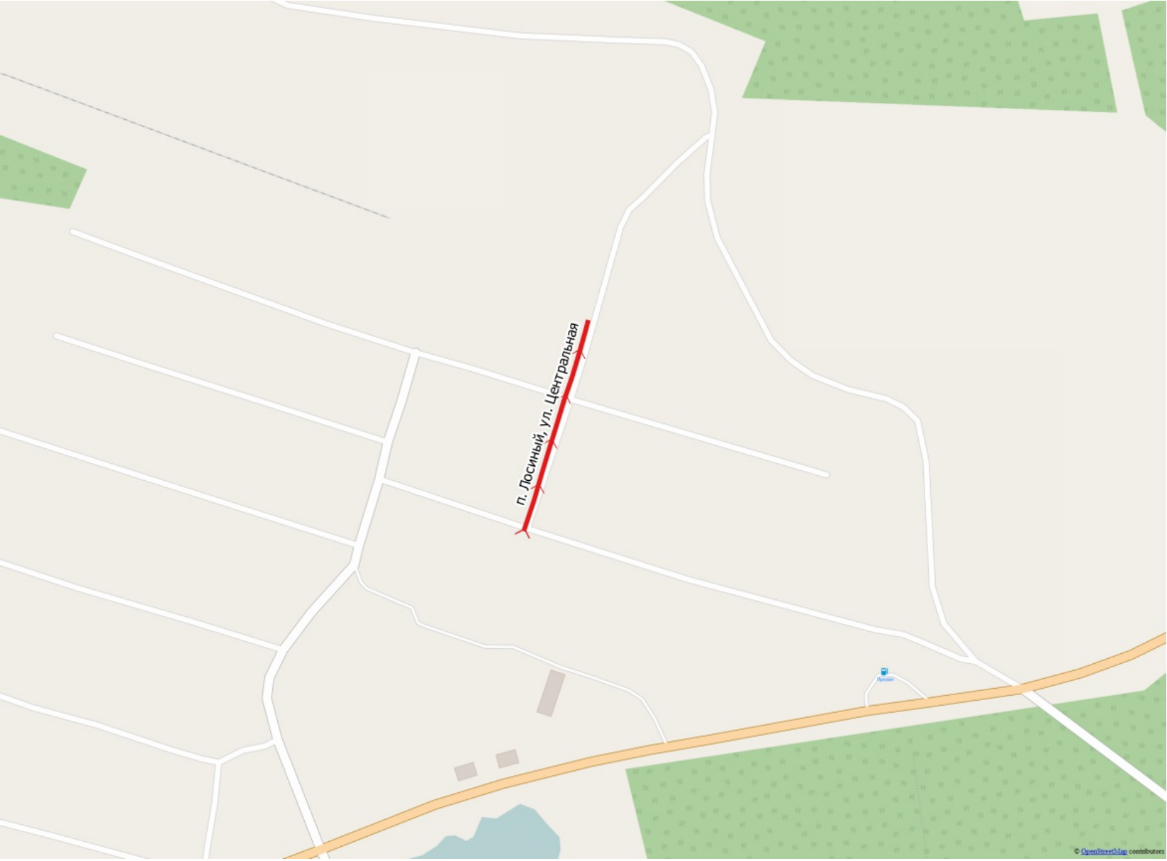
Схема расположения: п. Лосиный, ул. Центральная